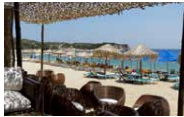
Beach Bar CAVO istočni deo plaže GPS: N39.9927330/E23.9897365