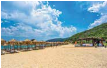
Beach Bar CHICA zapadni deo plaže GPS: N39.9905929/E23.9872531

Kalamitsi je malo mirno mesto za porodični odmor. Idealno je za sve koji žele da svoj odmor provedu u potpuno opustajućem okruženju, na prelepom pešćanoj plaži daleko od buke, noćnog života. Ponuda taverni, kao i kafića uz plažu dovoljna je da Vam u Kalamitsiju ništa neće nedostajati. Blizina Sartija (15km) i Neos Marmarasa (30km) moći će da upotpune Vaš odmor ukoliko se zaželite noćnog života i letnje vreve. Iako Vam lepša plaža neće trebati, egzotične plaže u blizini se teško mogu običi za 10 dana odmora. Na plaži u Kalamitsiju se nalaze beach barovi sa odličnom ponudom: